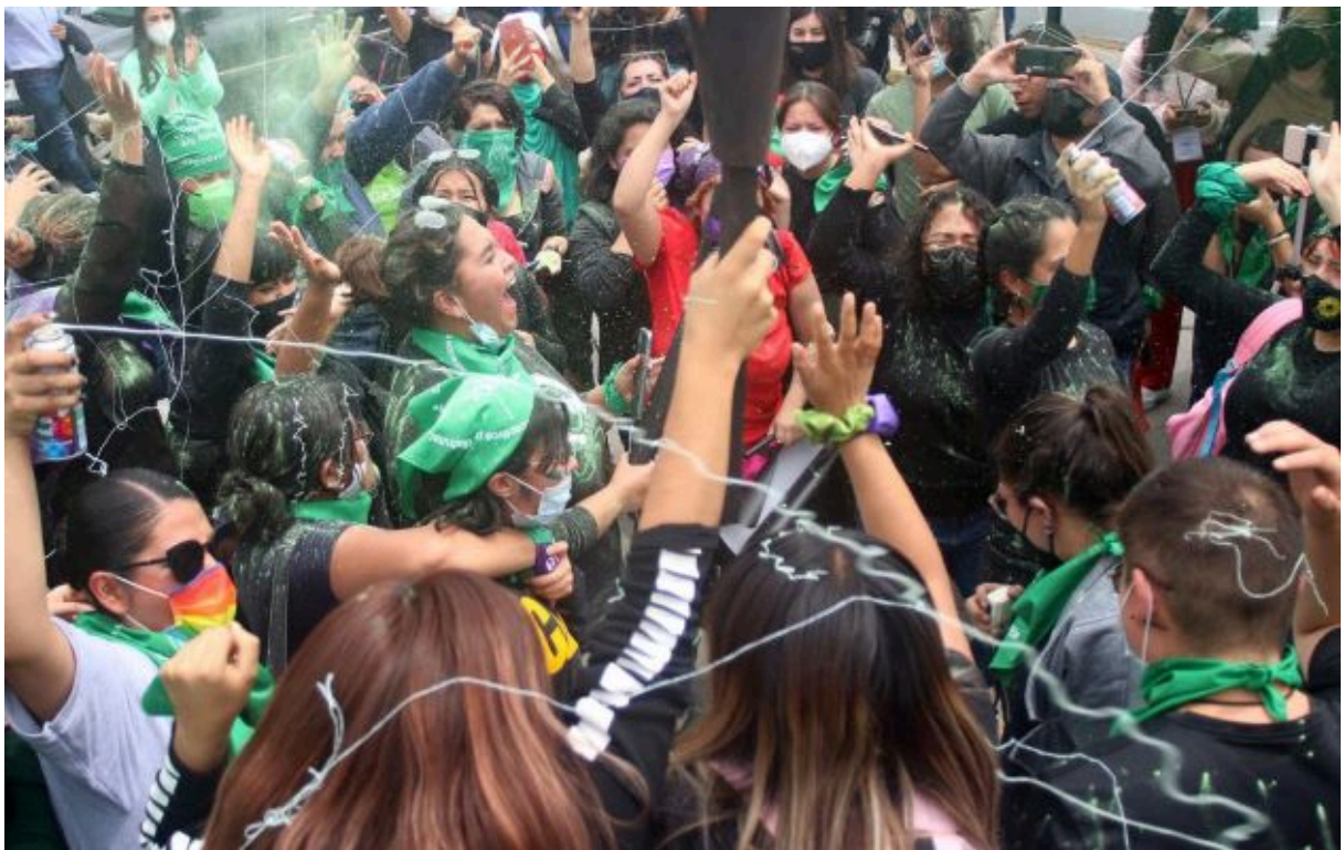
Celebración por día histórico en Hidalgo.

Esta iniciativa permite la interrupción del embarazo hasta la semana 12 . Hacerlo después de ese tiempo implica permanecer de 6 meses a 1 año de prisión ; y de 10 a 40 días de multa a la mujer que realizó el aborto que, para ese momento, sería considerado un delito.