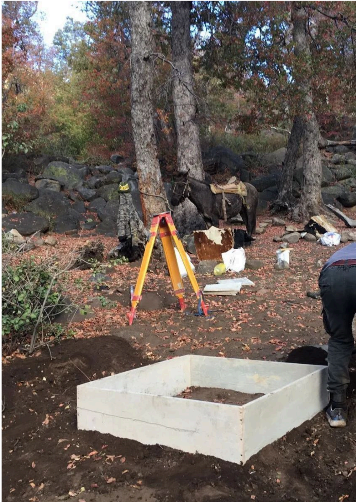
Además, se puede apreciar uno de los guardaparques de la Reserva, acompañado de su equipo para verificar que se respeten los límites de la solicitud y salvaguardar en lo posible la integridad de los