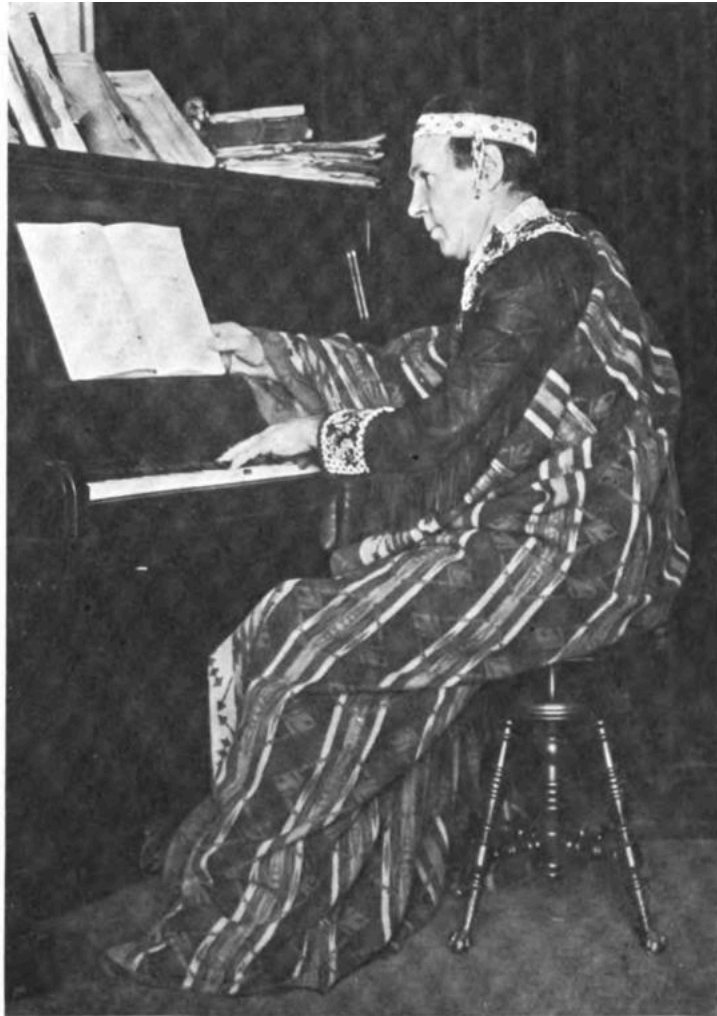
Chief Caupolicán ensayando en el piano en 1921.

Entre otras participaciones artísticas, Chief Caupolicán también interpretó un rol en la ópera indígena norteamericana “Winona”, la cual debutó en Minneapolis en 1928 y se basa en una leyenda local de la tribu Mississippi Chippewa. Como habíamos mencionado en la primera parte, el representar otras etnicidades indígenas a través de su atuendo fue muchas veces una imposición de sus managers, más que una opción propia. Sin embargo, es posible que parte de su aceptación también haya estado motivada por los movimientos pan-indigenistas de la época, en donde más que “pretender ser otro”, había una idea de solidaridad y reivindicación de derechos, en donde se buscaba visibilizar temáticas indígenas en general, con una mirada más fluida en cuanto identidades. De tal forma, él también grabó algunas canciones de la etnia Zuni, las cuales fueron comercializadas en discos de la RCA Victor.