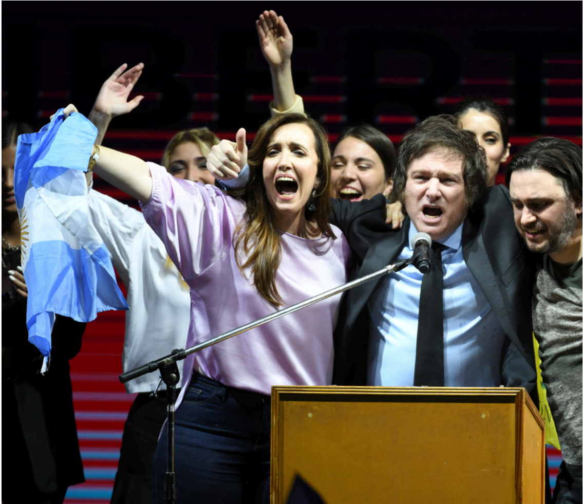
Javie Milei celebra su triunfo en las elecciones internas de Argentina. 13 de agosto de 2023.

Este domingo se consolidó como una figura disruptiva, ya que hace apenas tres años era considerado apenas como un personaje mediático que era invitado a los programas porque generaba 'rating' gracias a sus gritos, insultos y polémicas, pero nadie esperaba que tuviera una carrera política seria , mucho menos que ganara alguna elección.